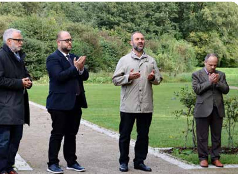
Einweihung eines muslimischen Grabfeldes